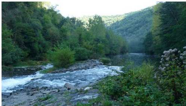
Photo de Najac: L'Aveyron au moulin de Ferragut.