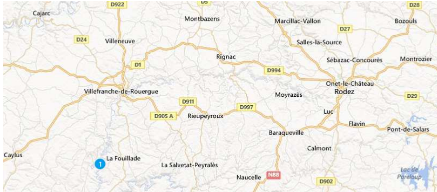
Situation de Najac