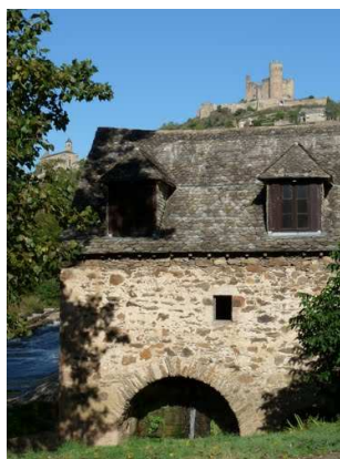
Le moulin d'Auribal