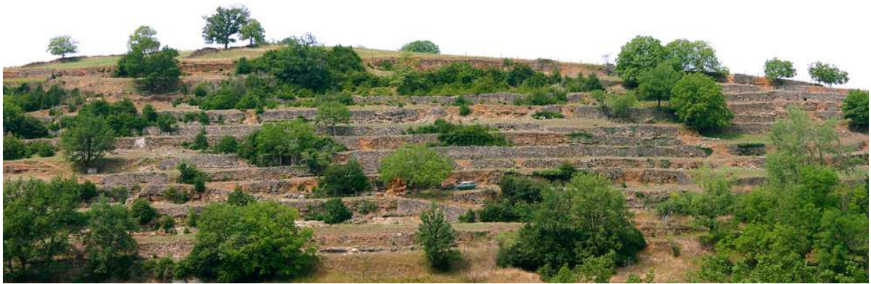
Dessus : Photos de Coubisou Dessous : photo de Sainte-Eulalie-d'Olt