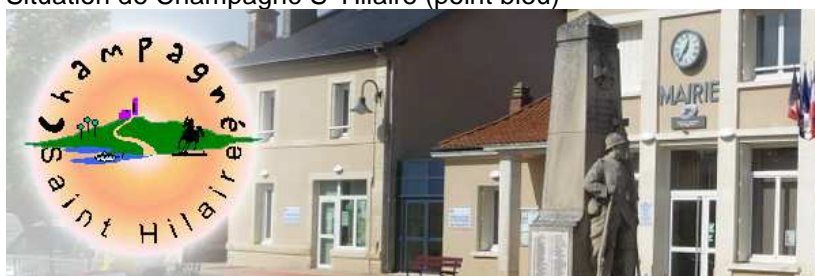
Mairie de Champagné-Saint-Hilaire(photo bannière du site de la ville)